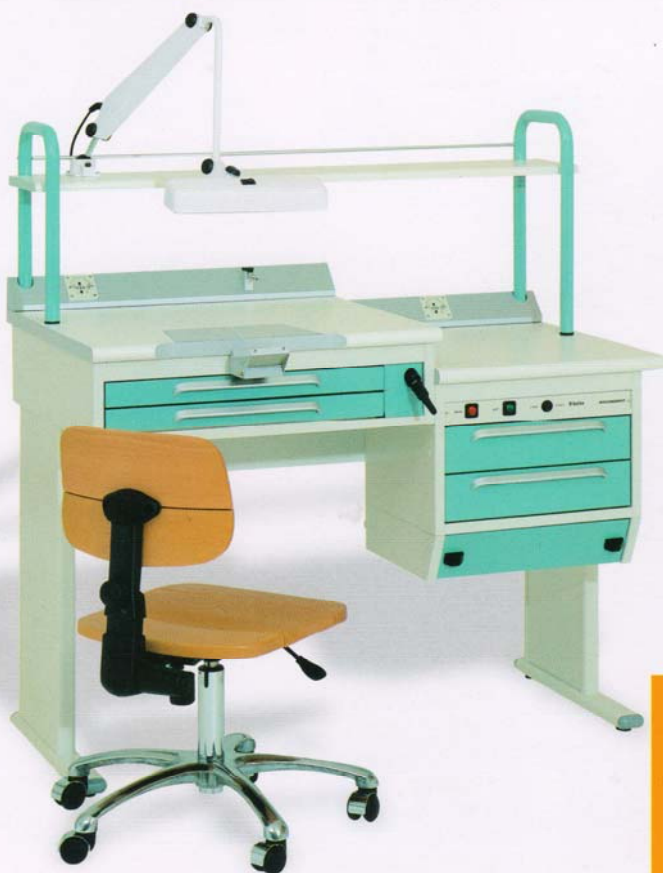
Banco ad un posto con cassonetto di servizio ribassato. One station workbench with lowered service box. (Dim. 1235x675x910 h mm)