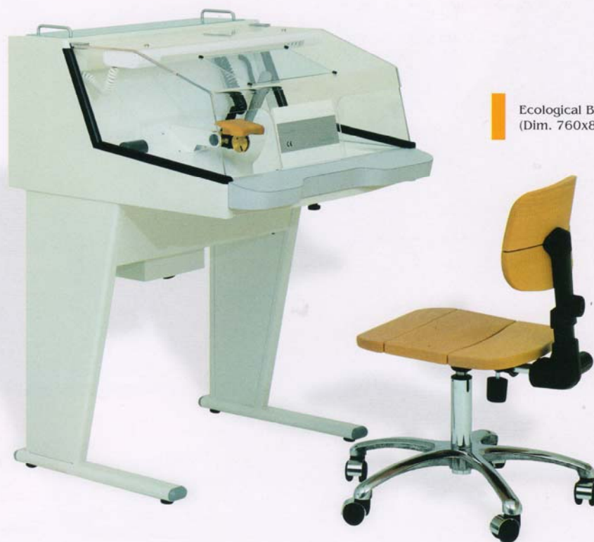
Ecological Box. (Dim. 760x820x1130h) mm

The working place is illuminated by two 18W cold light lamps. Hinged lift, up cover in plexiglass, tempered glass protective face shield.