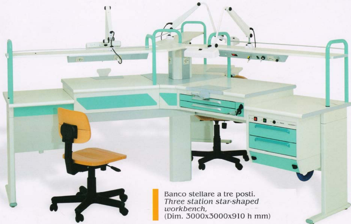
Banco stellare a tre posti. Three station star-shaped workbench, (Dim. 3000x3000x910 h mm)

Una linea di banchi dal design estremamente semplice e funzionale. In tutte le fasi della progettazione è stato dato ampio spazio ai più scrupolosi criteri tecnico-operativi e al rispetto delle norme di sicurezza comunitarie garantite dalla marcatura CE.