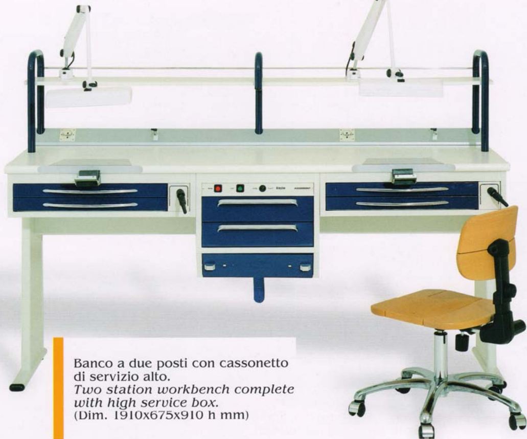
Banco a due posti con cassonetto di servizio alto. Two station workbench complete with high service box. (Dim. 1910x675x910 h mm)